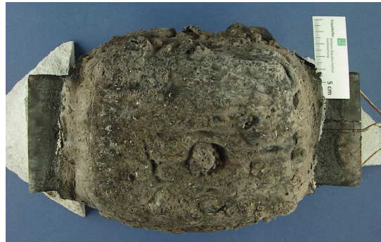
Bild 2 Aufgeschäumte Brandschutzbeschichtung nach einem Brandversuch

Bild 2 zeigt die aufgeschäumte Brandschutzbeschichtung nach 30-minütiger Normbrandbeanspruchung. Der isolierende Schaum erreichte eine Dicke von mehr als 4 Zentimeter und umschloss den geprüften Stützenabschnitt vollständig.